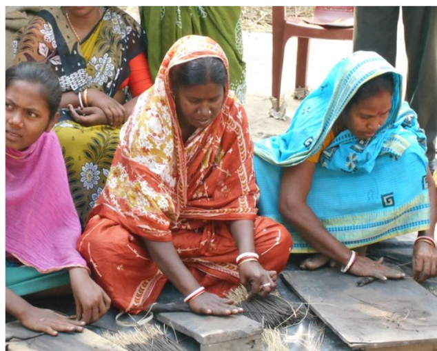
Røgelsespinde produktion foregår ofte i grupper, hvor kvinderne kan tale sammen mens de arbejder

Alle projektets mål er næsten blevet opfyldt, især i løbet af det sidste år, hvor den lokale ledelse er blevet forbedret. Den øgede støtte og bedre ansvarsfordeling mellem flere mennesker i projektledelsen har båret frugt i et sådant omfang at projektorganisationen kan bruges som et godt eksempel for andre projekter.