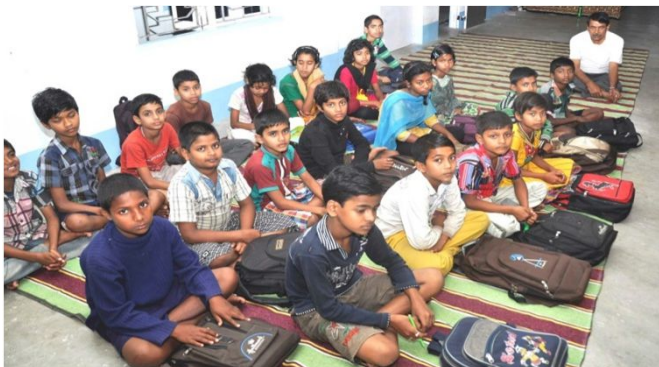
Kostskolebørn ved VSN, diskuterer landets og deres egne forhold

Pga bedre undervisning end i regeringsskolerne, er der interesse fra lokalbefolkningen for at sende deres børn til VSN skolen. Støtte fra IGF Danmark gennem lærergruppen med indførelse af Aktivitets Baseret Læring som bla indebærer glæden ved at lære, har hjulpet meget. Elevtallet er nået op på 205 (113 drenge, 92 piger). Der er 20 lærere, de fleste lokale.