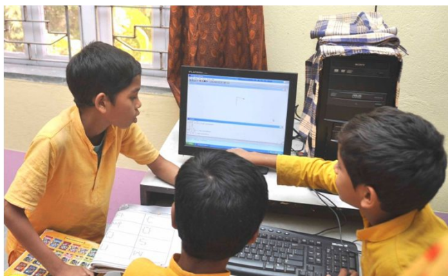
VSN skolebørn lærer at bruge computer støttet af en lærer

Computerundervisningen for VSN skolebørn fra 4. klasse og op efter fortsætter også for de store børn fra manuduktionsholdet og Tarun Tirtha holdet. Dette har skabt interesse blandt forældrene i omegnen for at sende deres børn til VSN. I 2014 deltog 83 elever fra VSN fordelt på 16 klasser samt 27 elever udefra.