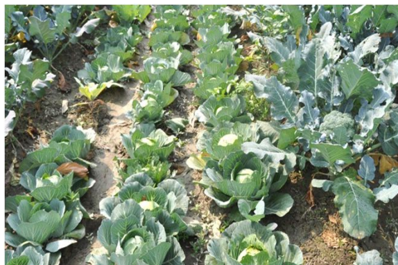
Blomkål dyrket på demonstrationsfarmen.