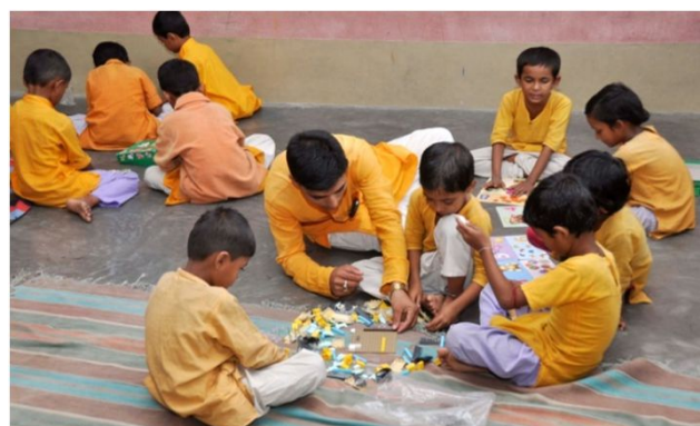
Børnene ved VSN skolen får undervisning af lærerne som blev trænet af danske lærere fra IGF (aktivtetsbaseret læring).

Det er tredje år skolen kører og efterhånden har man indhøstet så mange erfaringer at driften og undervisningen foregår rimeligt. Der er stadigvæk problemer da nye ting hele tiden kommer op. En ekstra klasse kommer til hvert år. Man har nu mere ned 20 kostelever. Der er både drenge og piger under samme tag. Det giver problemer når de kommer i puberteten. Desuden har børnene så svage og meget forskellige uddannelsesniveauer at det er en stor opgave for JGVK at sikre, at de svage når op til de andre.