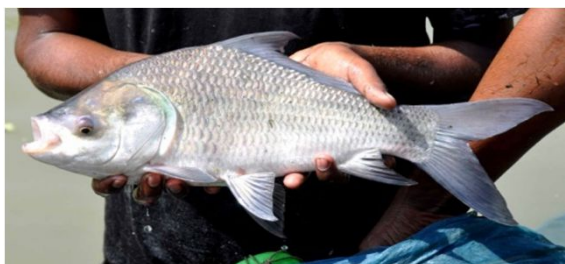
Egen avlet katla fisk på 1 kg på et halvt år - et godt resultat