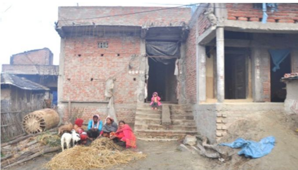
I Behli, Nepal bor familierne i ufærdige betonhuse, mens sønerne arbejder i Qatar for at støtte familierne og færdiggøre husene over mange år.

For ca. 70 år siden, da Indien blev uafhængigt, foreslog Gandhi at man afskaffede det top styrede engelske system og i stedet indførte decentralt styre, dvs nedefra blandt befolkningen i landdistrikterne. Dette passede absolut ikke de daværende ledere, som tilhørte eliten og de valgte at fortsætte med det topstyrede engelske system. I dag har Indien en befolkning på omkring 1,3 mia., hvor ca. 20 % er velstående og veluddannede, landet har produceret atombomber, sendt raket til Mars osv. Samtidig lever størsteparten af befolkningen stadig omkring eller under fattigdomsgrænsen. Pga. civilsamfundets manglende kapacitet og faldende produktion er forskellen mellem rige og fattige kommet på sådant et niveau, at store områder i landdistrikterne er tømt for unge mænd, som rejser væk for at kunne overleve, hvilket ikke er en holdbar situation. Det samme gør sig gældende i mange andre lande i Syd. I en landsby, Behli, i den sydlige del af Nepal, ser man kun ufærdige betonhuse i alle afskygninger beboet af gamle mennesker, samt kvinder og børn. Langt fra Nepal, i Qatar, opholder 400.000 unge nepalisere sig som gæstearbejdere. De lever under forfærdelige forhold, tjener ca. 2.500 kr/md, og en nepaleser dør hver anden dag i en arbejdsulykke. Mændene fra Sunderbans tager ikke til Qatar, men til de indiske storbyer som Bombay og Delhi hvor de også lever og arbejder under forfærdelige forhold.