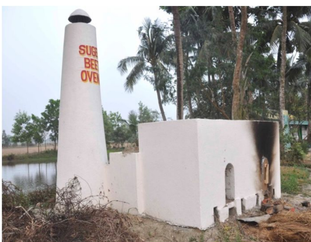
Ovn til fremstilling af molases fra sukkerroer

Gennem forskellige organisationer fortsætter vi samarbejdet med DTU. I 2014 har omkring 20 studerende besøgt projekter i Sunderbans som en del af deres eksamensopgaver. Dansk kapacitet og udviklingserfaring er et nøgleelement for IGF Danmark i vores bestræbelser på at sikre udvikling i det kapacitets- og erfaringsvage Indien. Her udnytter man de studerendes kapacitet i Indien under vejledning af deres lærer og ledelsen fra IGF Danmark. Man bruger dette som en slags fortalervirksomhed til at gøre dem interesseret i fortsat at anvende deres erhvervede kompetencer og erfaringer som aktive IGF Danmark medlemmer efter hjemkomsten. To studerende har besøgt Sunderbans i 2 uger for at undersøge arbejdet med sukkerroer hos JGVK. De talte med landmændene og et par videnskabsfolk og har skrevet en rapport om det. De agter at fortsætte. De præsenterede et oplæg med en ovn som skal producere molases fra sukkerroer i Sunderbans. IGF Danmark har opsat en ovn ved JGVK til at producere molases fra sukkerroer. Der er problemer med dens funktion som skal checkes af kyndige fra Danmark.