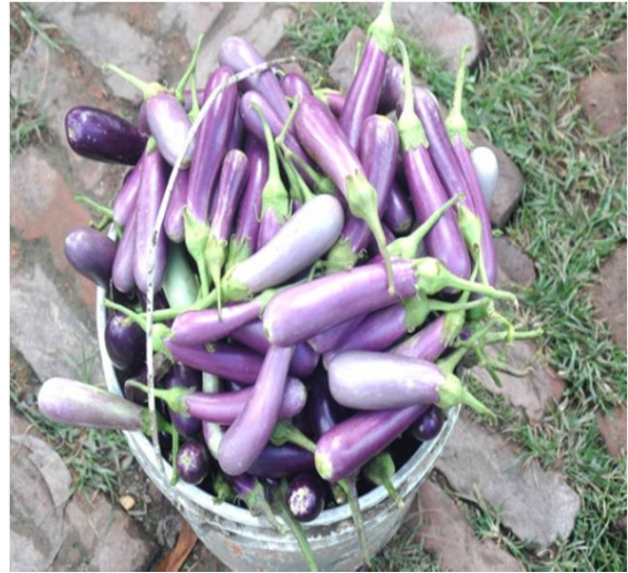
Auberginer produceret på demonstrationsfarmen.