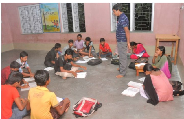
Børnene får supplerende undervisning i bedre forhold

Uddannelse er blevet en modesag. Alle skal have en uddannelse, som giver en bedre fremtid: et godt job, et arbejde som er mere behageligt end landmandens o.l. Det er rigtigt at næsten alle børn nu går i skole i modsætning til tidligere. Men det er kun begyndelsen, det videre forløb ser temmelig anderledes ud. Forældrene som sender deres børn til regeringsskolen er fattige, har næsten ingen uddannelsestradition, lærerne har ikke nogen særlige undervisningskompetencer, deres interesse i undervisning er kun som en indtægtskilde, eleverne har mindre betydning og der er ofte 70-70 børn i en klasse. Konsekvensen af dette er at over 80% af eleverne forlader skolen inden de når 10. skoleår. Disse dropout børn er så godt som analfabeter og overlever som daglejere. Resten får en uddannelse som er af så dårlig kvalitet at den ikke kan bruges til noget.