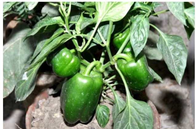
Forsøg med dyrkning af peberfrugt som er næringsrige og indtægtsskabende for de lokale landmænd

Landbrugsaktiviteterne fortsætter med IGFs egne midler (se side 17). Det er et af de vigtigste områder hvor udviklingsarbejdet skal styrkes, fordi den faldende produktivitet gør det sværere og sværere for familierne at overleve. Den stigende udvandring af mange mænd fra området skaber store problemer for lokal samfundet. I forsøget på at øge produktiviteten afprøver JGVK forskellige næringsrige afgrøder og økologiske metoder på en demonstrationsfarm og prøver at få landmændene til at anvende dem på deres egen jord. En meget større indsats er nødvendig, men med vore begrænsede midler er det svært.