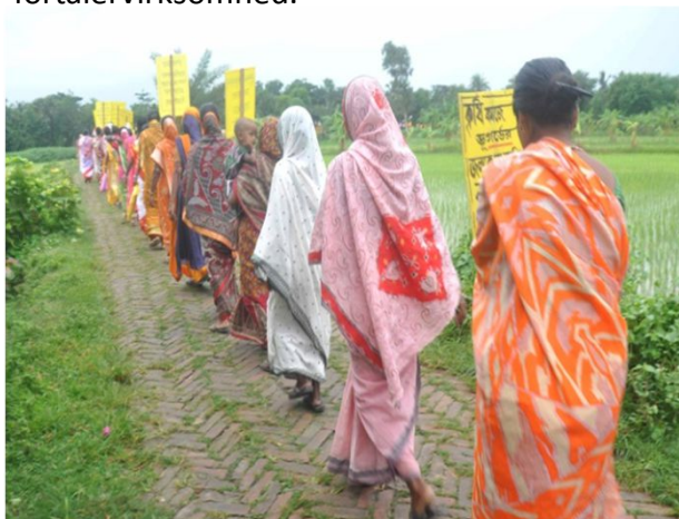
Lokale kvinder demonstrerer for deres rettigheder.