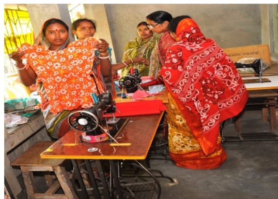
En af de lokale kvinder lærte at sy i HI projektet og viser sit produkt frem. Hun syer sammen med nogle af de andre piger i sin landsby.