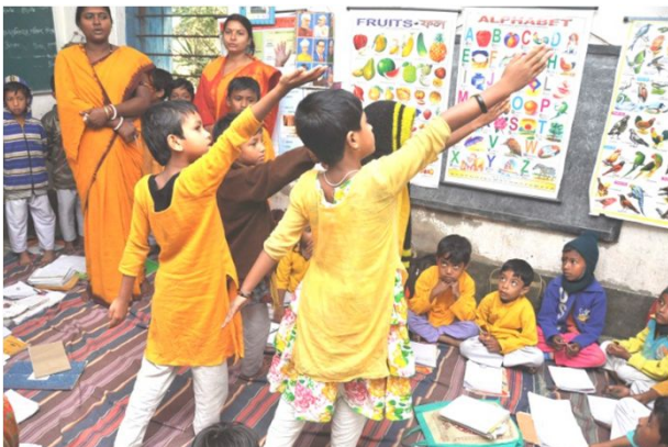
Undervisning i Amlamethi skolen, Gosaba

Undervisningen her er bedre end i regerings skolerne, hvorfor der er pres på fra lokale familier for at få deres børn i disse skoler. I år blev hhv 9 og 10 forældremøder afholdt i Bermajur og Amlamethi