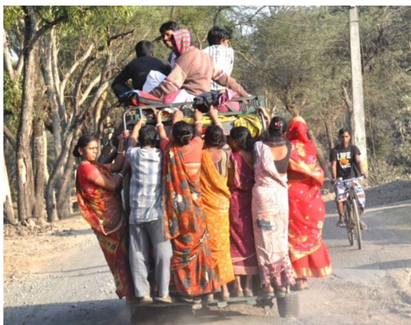
Livet er hårdt for de fattige i Indien og de er de fleste.

For mere information om vores organisation og vores arbejde både i Danmark og Indien, se vores hjemmeside: www.igfdanmark.dk