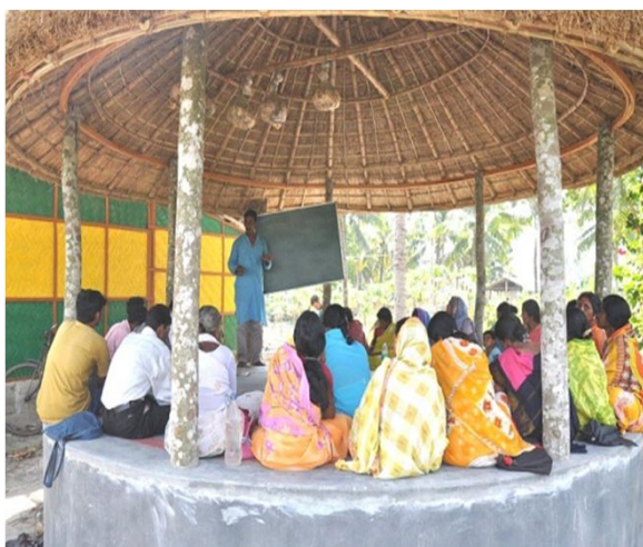
Undervisning i landbrug og køkkenhave.