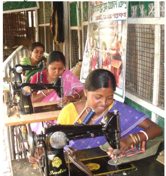
Landsbykvinder lærer at sy og sælge varerne vha mikrokredit

Vi har indført mikrokredit for ca. 5 år siden bestående af interne lån blandt medlemmerne af en SHG, samt mellem SHG'er via landsbykomiteerne, hvor SHG'er kunne udlåne deres ubrugte midler til andre SHG'er. Med øgede aktiviteter fik brugerne behov for større beløb som deres