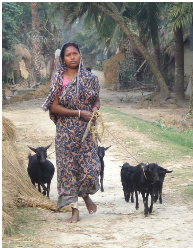
En projektbruger på vej hjem med sine geder i Sunderbans

Til trods for vanskelighederne fortsætter projektet med at producere gode resultater. Den tillærte Farmer Field School (FFS) træningsmetode fra sidste år blev anvendt i 3 landsbyer med stort udbytte hos landmændene, som fandt den pædagogiske metode meget effektiv og inspirerende. Der er interesse hos flere landsbyer for FFS træning, dels er der behov for anvendelse af FFS i andre fagområder end husdyrhold, f.eks. landbrug, fiskeri mm. Antallet af brugere er blevet udvidet til ca. 3000 i pro-