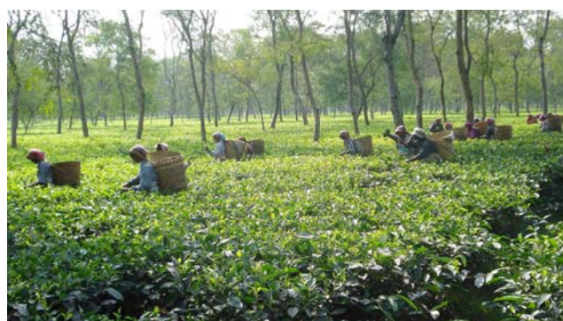
LKP støtter fattige daglejere i te plantager i Kalchini distriktet i Nordbengalen