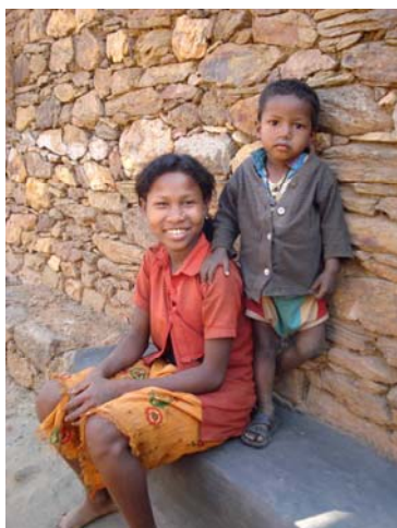
Søskende fra en santal familie i Purulia

Mere information vil løbende være til rådighed på hjemmesiden www.innoaid.org