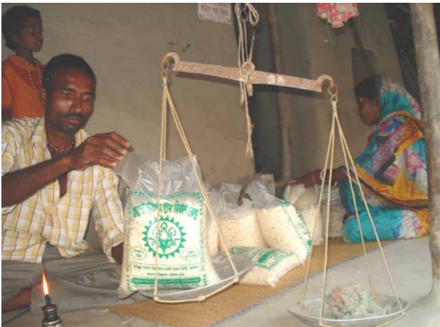
JGVK brugerne producerer/sælger ris-popkorn med mikrokredit

ver sikkerhed for deres penge, som JGVK så skal give. Dette kræver stor indsats dels for at holde aktiviteterne i gang dels sikre tilbagebetalingen, som er et stort arbejde. Derudover udsættes JGVK brugerne for ubehagelige oplevelser i bankerne; man nægter at udbetale deres penge, chikanerer dem ved at hænge sig i petitesser o.l. Årsagen til dette er at bankudlånene administreres af lønmodtagere uden socialt ansvar. Derfor ønsker man at udvikle lokalt banksystem som varetager brugerne interesse, er mindre omkostningsfuld og tilpasset til brugersamfundet i landsbyområdet. Man arbejder på at udvikle et system som vil kunne integreres i brugersamfundet på landsbyniveau med landsbykomiteerne som ejere af enheder. Dette kræver nogle års afprøvning før der kan opnås et stabilt system og en større anvendelse vil være mulig med overdragelse af ansvaret til brugerorganisationerne.