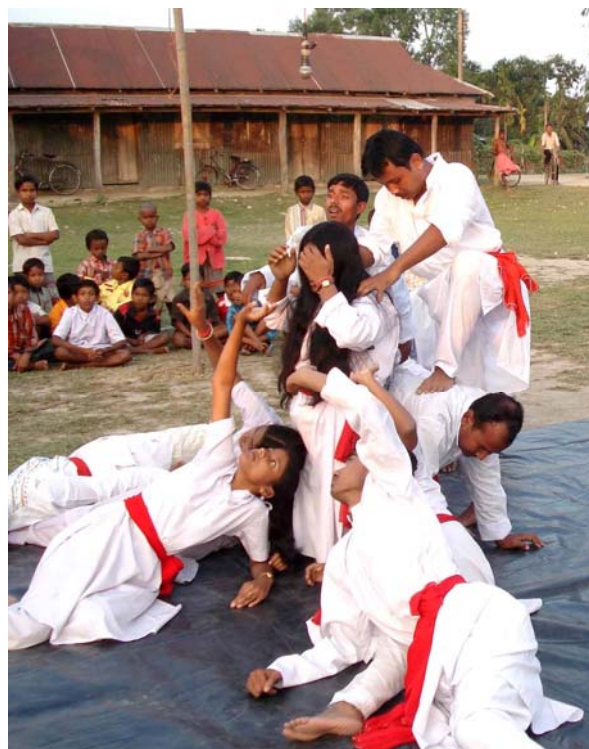
LKPs gadeteater; opvisning for IGF medlemmerne

righed hver. Omkring LKP-CSO-GP samarbejde, er der udført 2025 gruppemøder; LKP ansatte arrangerede 433 kulturelle og bevidstgørelses aktiviteter, kampagner til at organisere GUS'er. For at styrke netværkssamarbejdet både på regerings- og civilsamfundsniveau blev 16 programmer udført med alle de implicerede deltagere. Rettighedsbaseret kapacitetsopbygning er blevet udført blandt CSO medarbejdere vedr. GP system, social ansvar, lokal regeringsførelse, rettighed til information o.l. i 6 distrikter. IUK projektet har lavet træningsmateriale vedr. GP i samarbejde med CARE, Vestbengalen. Desuden er der udgivet en månedlig avis på flere forskellige sprog vedr. GP og 4 speciale udgivelser og sendt til 3354 GP'er. For at støtte brugere har man oprettet en informations telefonlinie til 319 abonnenter som har kaldt 1466 gange. Sammen med en lokal teatergruppe 'Sab Peyechi Ashar', har LKP organiseret 12 boder i distriktet vedr. social retfærdighed, landbrug o.l. For at øge informationen vedr. GP og decentral management af naturressourcer er der opstartet 25 informationscenter hos lokale CSO'er i 13 distrikter. Letlæselige udgaver af diverse love er publiceret ifa et større antal pjecer for at øge befolkningens deltagelse. LKP støtter de lokale myndigheder i udviklingen af netværk indenfor uddannelse og SHG. Derudover er der udført studier der skulle