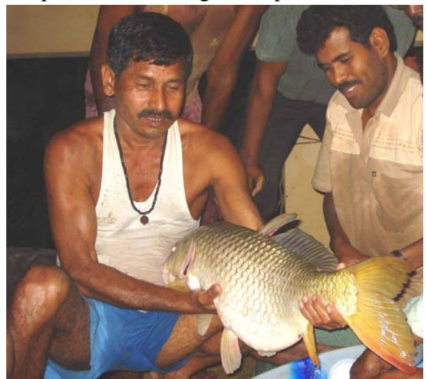
Kvalitets fisk bruges til larvereproduktion hos JGVK

Fiskeri i Sunderban med KVL, BAU & AwF: Bestræbelserne på at udnytte det enorme uudnyttede potentiale omkring fiskeriproduktion blandt