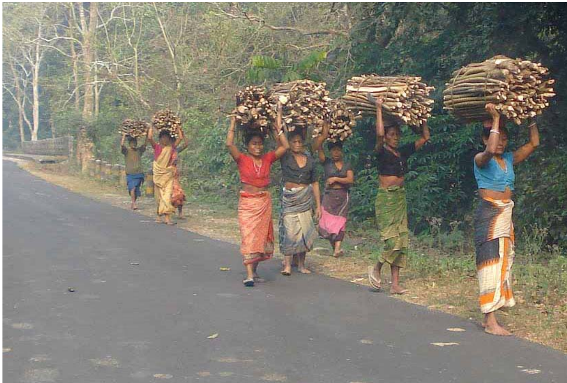
Fattige lokale beboere samler brænde i Duars skovområdet i Nordbengalen