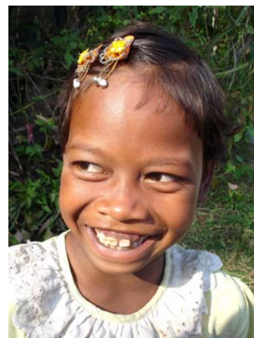
Stammepige ved te plantage i Kalchini