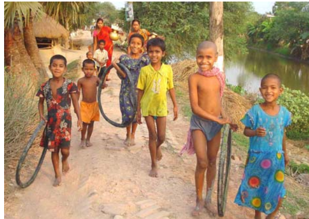
Manglende omsorg og uddannelsesmuligheder sender mange børn på gaden, hvilket er et stort samfundspøblem

I gennemsnit er der ca. 80% frafald (= drop outs) af elever i skolen inden de når 10. klasse i Vestbengalen. I landdistrikterne er det over 90%. Den starter ret tidligt, men frafaldet er størst omkring 6-8 klasse, hvor omkostningerne stiger markant. Haldor Topsøe, som er en kendt er-