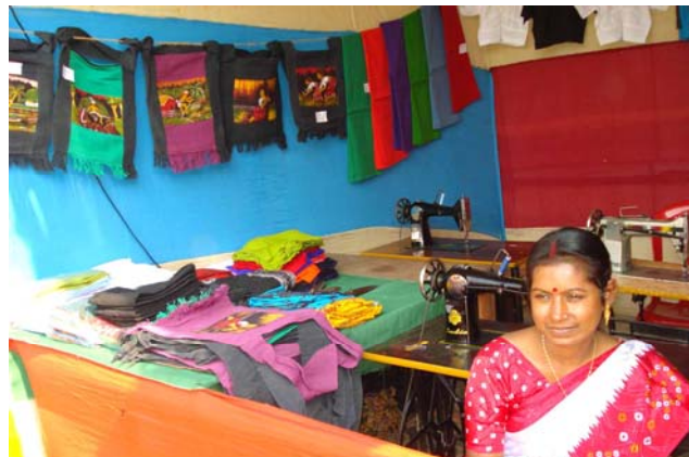
Kollektion på lokal udstilling i Sunderbans

Det er knap et år siden at Hjemmeindustriprojektet stoppede i Projektpuljeregi men projektet har fortsat med et mindre tilskud fra IGF's side til løn til få ansatte. I oktober ansøgte vi så om en