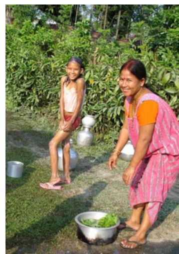
Med en smule vand fra te plantagen må brugerne rense grøntsager, tage bad og andet