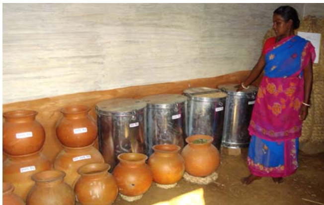
LKP brugerne har selv oprettet frøbank i Purulia

Projektets fase 3 er igangsat sammen med vores lokale partner LKP og skal køre i 4 år. Projektet bygger videre på de to foregående faser og foregår geografisk i Vestbengalen i distrikterne Birbhum, Nord og Syd Dinajpur, Jaipalguri og Purulia samt