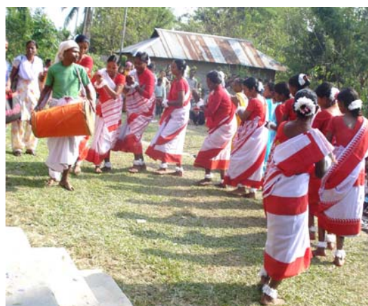
Stamme pigerne byder IGF medlemmer velkommen med folkedans i en te plantage i Kalchini.