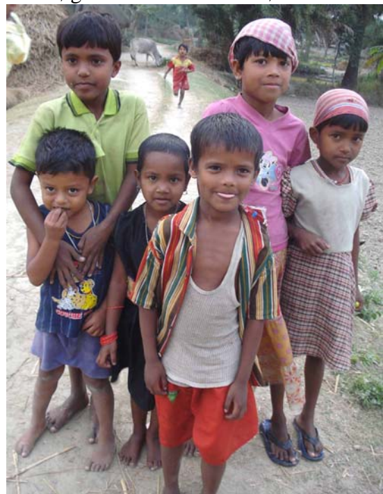
Manglende uddannelsestradition forhindrer lokal udvikling

at give børnene en opmuntrende og inspirerende start i livet, som giver dem et stærkere livs fundament. Skolen hos JGVK fortsætter med ca. 80 børn. Selv om der mangler meget, er børnene glade for at komme til skolen og lære noget. Til næste år skulle skolen udvides til 5. Klasse. Lige nu går børnene til de offentlige skoler efter 4. klasse, hvor de første elever nu har gået 2 år og klarer sig fint. Disse resultater er opmuntrende og skal danne grundlag for en ændring af uddannelsesforholdene i lokalområdet. Det er et stort ønske at øge bevidstheden hos børnene omkring