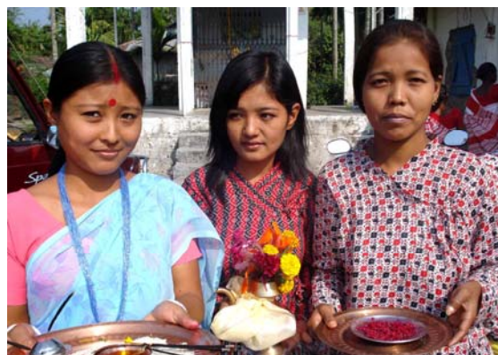
LKP brugere byder IGF medlemmer velkommen i en te plantage i Kalchini, Nordbengalen.