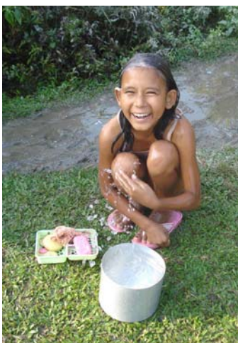
Nepali pige bader i en skål vand, Kalchini