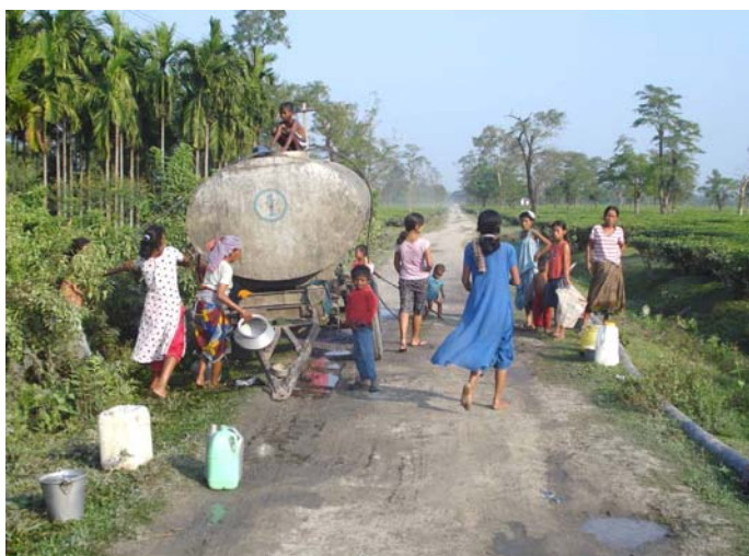
Daglejere må klare sig med daglig vand forsyning fra te plantageejere

Pga den svage lokale kapacitet og økonomi, samt presset på miljøet, er der behov for en målrettet indsats. I de kommende år vil man øge indsatsen omkring kapacitetsopbygning for unge og voksne, udvikling af miljørigtige løsninger inden for ovennævnte områder og integrere de opnåede resultater og overdrage aktiviteterne til brugernes sammenlutninger og netværket. Den nuværende udvikling med stigende energi- og madpriser gør ikke arbejdet lettere. Der er behov for mere samarbejde med videntcentre i Danmark og udenfor DK samt andre organisationer som beskæftiger sig med lignende aktiviteter gennem erfarings udveksling.