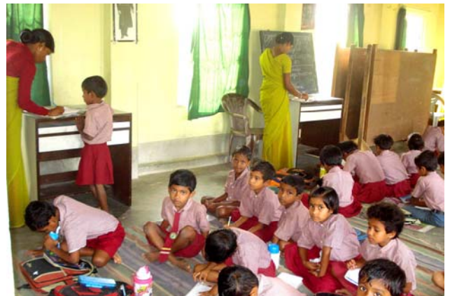
Flere klasser undervises i samme lokale på JGVK skolen

fundet. Derfor støtter vi 10 uformelle uddannelsescentre med basis i boglig- og kulturel lærdom i projektområderne. Et af de vigtige elementer er